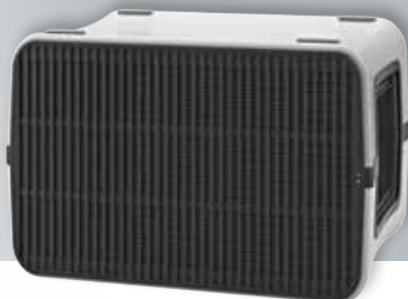
Автономная установка «Премьер»*