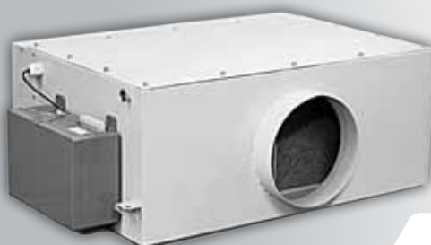
Установка канального типа в едином внешнем корпусе*

Системы «Поток 150-М-01» по своим характеристикам соответствуют санитарным и строительным требованиям: